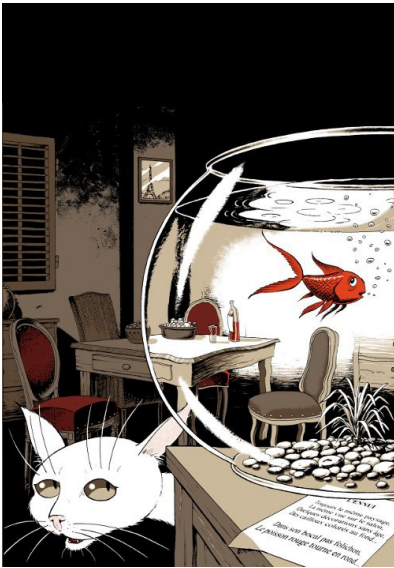
L'ennui, par Turf

Voici un livre d'images pour tous qui, nous l'espérons donnera envie au lecteur-spectateur d'écrire à son tour quelques vers et de les illustrer.